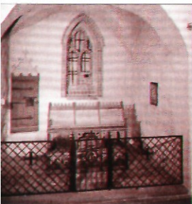
В капелле Святого Георгия, часовне рода Гезелиусов, покоится канонизированный к лику святых епископ Хемминг.

Частые пожары вынуждали видоизменять конструкцию шпиля башни собора. Наиболее сокрушающим был пожар 1827 года, уничтоживший почти весь город. Не уцелели также башня и интерьер собора. Возведённая после пожара башня достигает высоты 101 м над уровнем моря и является символом, как собора, так и всего города.