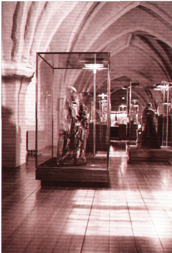
Кафедральный музей находится на южной галерее собора. Ценные церковные реликвии были впервые представлены посетителям по завершении реставрационных работ в 1982 году.