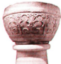
Средневековая купель из финского известняка.

Собору Турку уже более 700 лет. В XIII веке, когда Турку стал важнейшим торговым центром страны, было принято решение перенести главное святилище Финляндской епархии в центр Турку, на холм Униканкаре. Ранее основная церковь епархии находилась в местечке Коройнен, на берегу той же реки Ауры, но в нескольких километрах к её истоку, в точке слияния Ауры и Вяхйюки. Новый каменный храм было решено возвести на месте деревянной церквушки. Строительство нового собора было завершено к концу того же столетия, а церемония его освящения состоялась в 1300-м году. Собор был именован в честь двух покровителей, Девы Марии и Святого Хенрика, первого епископа страны.