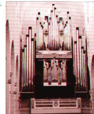
В 1980 г. в соборе был установлен новый 81-регистрационный орган фирмы Вейкко Виртанен.

Одна из фресок повествует об истоках христианства Финляндии, изображая момент крещения финнов епископом Хенриком у водного родника в Кушиттаа. На другой фреске изображён реформатор церкви Микаэль Агрикола в момент вручения им королём Густавом Вазе Нового Завета, переведённого им на финский язык.