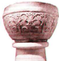
Средневековая купель из финского известняка.

Собору Турку уже более 700 лет. В XIII веке, когда Турку стал важнейшим торговым центром страны, было принято решение перенести главное святилище Финляндской епархии в центр Турку, на холм Униканкаре. Ранее основная церковь епархии находилась в местечке Коройнен, на берегу той же реки Ауры, но в нескольких километрах к её истоку, в точке слияния Ауры и Вяхйюки. Новый каменный храм было решено возвести на месте деревянной церквушки. Строительство нового собора было завершено к концу того же столетия, а церемония его освящения состоялась в 1300-м году. Собор был именован в честь двух покровителей, Девы Марии и Святого Хенрика, первого епископа страны.