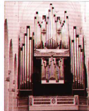
В 1980 г. в соборе был установлен новый 81-регистрационный орган фирмы Вейкко Виртанен.

Одна из фресок повествует об истоках христианства Финляндии, изображая момент крещения финнов епископом Хенриком у водного родника в Кушиттаа. На другой фреске изображён реформатор церкви Микаэль Агрикола в момент вручения им королём Густавом Вазе Нового Завета, переведённого им на финский язык.