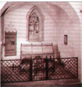
В капелле Святого Георгия, часовне рода Гезелиусов, покоится канонизированный к лику святых епископ Хемминг.

Частые пожары вынуждали видоизменять конструкцию шпиля башни собора. Наиболее сокрушающим был пожар 1827 года, уничтоживший почти весь город. Не уцелели также башня и интерьер собора. Возведённая после пожара башня достигает высоты 101 м над уровнем моря и является символом, как собора, так и всего города.