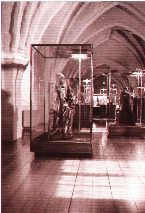
Кафедральный музей находится на южной галерее собора. Ценные церковные реликвии были впервые представлены посетителям по завершении реставрационных работ в 1982 году.